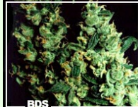
Jock Horror 50 samen 240,00EUR